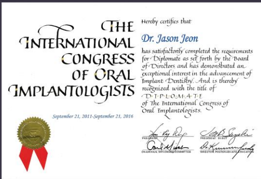
국제 학회 인증 ICOI Certificate

국내학회와 국제학회 회원 자격을 동시에 취득하고 세계적으로 인정받는 Diplomate Certificate 를 받으실 수 있습니다.